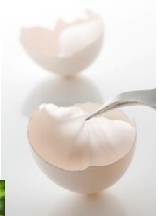
注目の美容素材「卵殻膜」

また、鉱物油や石油系界面活性剤、合成香料、着色料、アルコール、パラベンは無添加で、“配合しないもの”にもこだわった、肌に優しい処方ボディソープです。