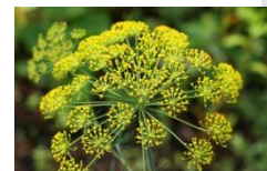
ウイキョウ油を配合